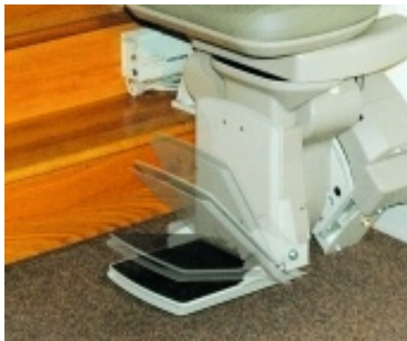
Elektrisch klappbare Fußstütze